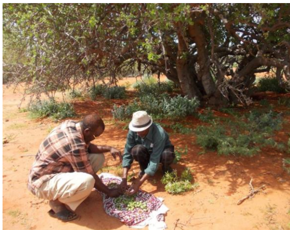
Kestävimmistä puista kerätään siemeniä ja niistä kasvatetaan taimia istutettavaksi hankealueille.

Etiopiassa oli paha kuivuus vuonna 2016, mutta ihmisiä ei kuollut samassa määrin kuin Somaliassa, koska Etiopian tilanne on ollut rauhallinen. Somalian lisäksi hauraita valtioita ovat mm. Eritrea ja maailman uusin itsenäinen valtio, vuonna 2011 itsenäistynyt Etelä-Sudan. Somalia on korkealla myös erilaisilla listoilla, joilla kuvataan, miten ”romahtaneita” (engl. failed state) valtiot ovat (kts. esim. http://www.globalis.fi/Tilastot/Romahtaneet-valtiot )