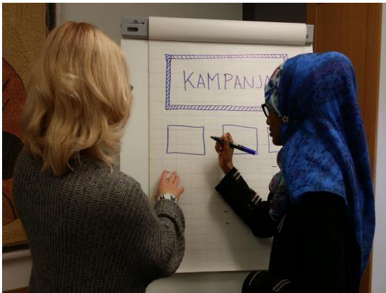
Vaikuttamishankkeessa nuoret pääsevät kehittämään yhteiskunnallisia vaikutustaitojaan mentoreiden ohjauksessa.

Järjestöjen hankkeita hallinnoi usein palkattu henkilökunta, mutta vapaaehtoiset ovat usein avainasemassa hankkeiden toteuttamisessa ja yhteyksien luomisessa kohdemaahan. Erona yksisuuntaiseen kehitysapuun on se, että kehitysyhteistyö todellakin on monikulttuurista yhteistyötä, jossa päivittäin etsitään yhdessä parhaita toimintatapoja ja vaihdetaan tietoja puolin ja toisin, ja jossa kummallekin osapuolelle entuudestaan tuntematon tieto tulee näkyväksi ja arvokkaaksi kokemuksen kautta.