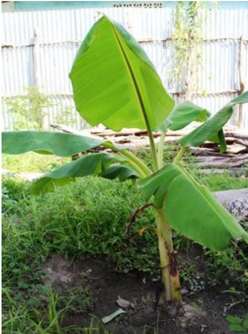
Med miljöprojekt bromsar man ökenspridningen genom att ge människor information om kopplingen mellan skogen och vattnets kretslopp.

utländska kvalifikationer än de som har stannat kvar i landet.