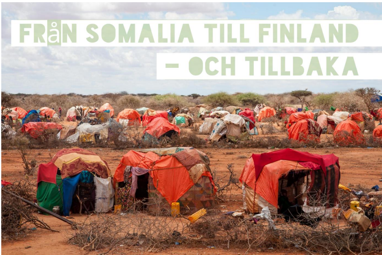
Torkan har drivit nomader till flyktingläger.