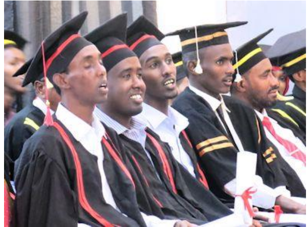
Ungdomar som utexamineras från universitet vågar inte lita på deras jobbmöjligheter i framtiden.

kommer att få anställning inom sitt eget område eftersom det inte finns några jobb tillgängliga och eftersom de få befintliga jobb som finns går till arbetsgivarnas släktingar och klanmedlemmar eller till somalier som återvänt från diasporan.