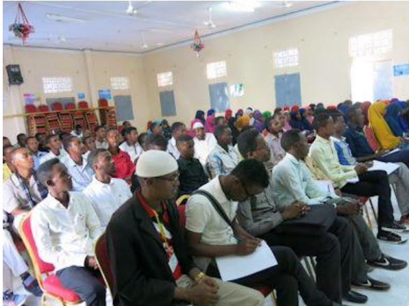
Nästan alla känner någon som har farit till Europa.

grannskapet. Många av hans vänner hade lyckats ta sig till Europa, några var fortfarande på väg eller döda.