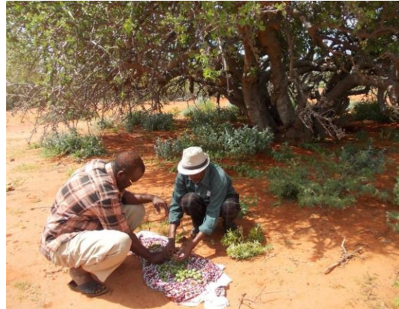
Frön samlas in från de mest hållbara träden och av dem odlas plantor som planteras i projektområdet.

Etiopien drabbades av allvarlig torka 2016, men människor dog inte i samma utsträckning som i Somalia eftersom situationen i Etiopien har varit lugn. Andra sköra stater förutom Somalia är Eritrea och världens nyaste självständiga stat, Sydsudan som blev självständigt 2011. Somalia hittas också högt på olika listor som beskriver hur "kollapsade" länderna är (se till exempel Misslyckade stater )